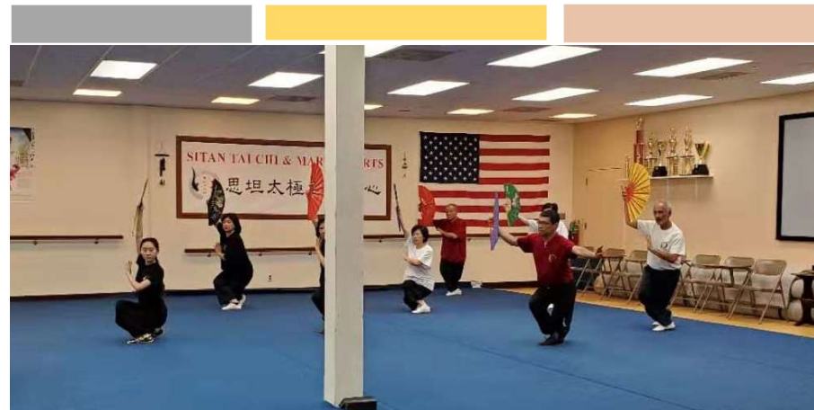
周一、三、五、日上午还有成人太极健身气功课！

让不同年级阶段的孩子进入不同的教室进行测试，Crescendo Math Club 暑期将根据学生的兴趣和水平进行分班，因材施教，更好地培养孩子们的数学兴趣和思维的灵活性！